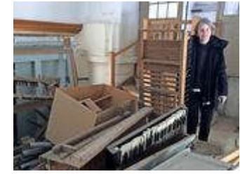
Hundertjährige Orgel ist Trümmerhaufen