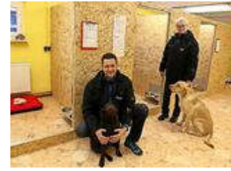
Erste Hunde-Reha-Station öffnet im Fläming